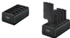
5槽底座电池充电器 FZ-VCBT131R