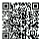
K120 3D demo